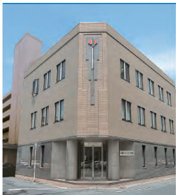
株式会社 小笠原 本社 (第二小笠原ビル)